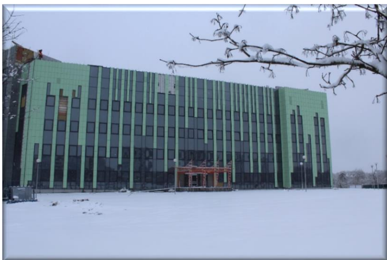
«Строительство детской поликлиники в г. Жодино»

Объекты здравоохранения 14 560,0 тыс.руб. (39,6%)