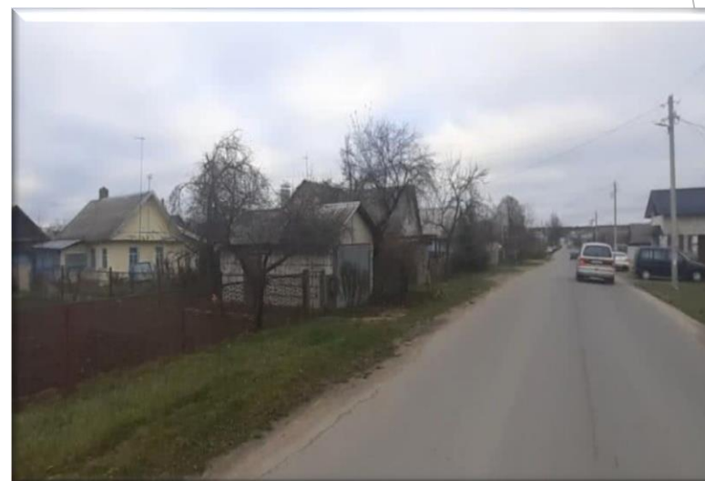
«Устройство ливневой канализации по ул. Витебская в г. Жодино»

Объекты жилищно-коммунального хозяйства 30,0 тыс.руб. (0,7%)