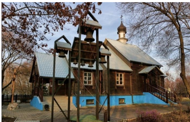
Церковь Святого Архангела Михаила

35 лет назад возрождённый храм Святого Архангела Михаила (ул. Московская, 113) был освящен Митрополитом Минским и Слуцким Филаретом. (27.10.1991 г.)