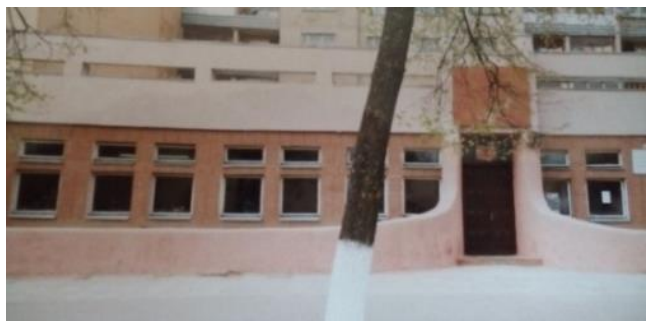
Жодинская городская детская библиотека (2002)

60 лет со дня основания Жодинской городской детской библиотеки, которая первоначально размещалась в подвале кинотеатра «Юность», а потом была переведена в другое здание по ул. Московской. В настоящее время не функционирует. (1966 г.)