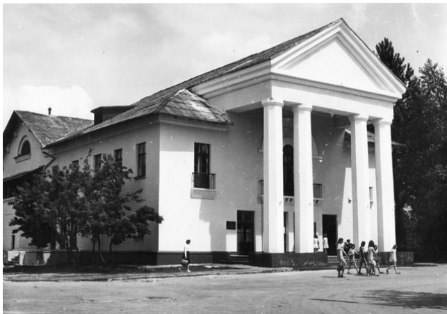
Жодинский городской дом культуры (1960-е годы)

35 лет назад на базе ДК ТЭЦ, открытого в 1953 году, был создан Городской дом культуры. В настоящее время в здании Городского дома культуры находится Дом квестов. (1991 г.).