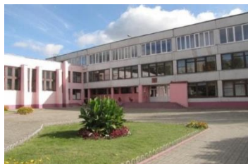
Средняя школа №7 (2004)