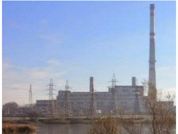
Жодинская ТЭЦ (2005)

10 лет назад на базе социально-педагогического центра был открыт первый в Беларуси Дом понимания для оказания помощи детям-