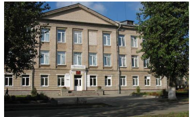
Средняя школа №2