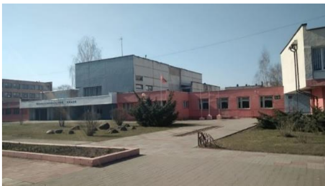
Жодинский профессиональный лицей

30 лет назад в Жодино был создан Центр профессионального образования (с 7 июня 2000 – Жодинский профессиональный лицей). (25.03.1996 г.)