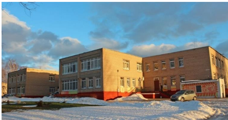
Жодинский дошкольный детский дом (2002)

55 лет назад был открыт Жодинский дошкольный детский дом. Являлся социально-педагогическим учреждением с максимально благоприятными условиями для интеллектуального, эстетического, нравственного, эмоционального и физического развития детей-сирот и детей, оставшихся без попечения родителей, подготовки их к обучению в школе и самостоятельной жизни. Расформирован летом 2017 года, а 22 сентября в этом здании открылся ясли-сад №3 «Теремок» (21.01.1971 г.)