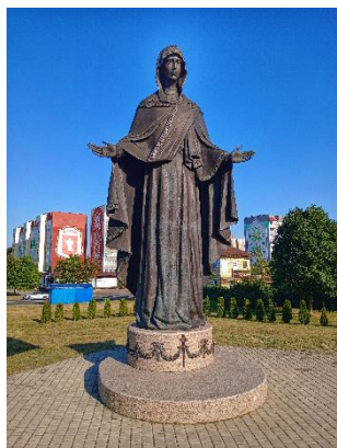
Статуя Божьей Матери

15 лет назад в День машиностроителя впервые в Жодино прошел международный спортивный конкурс по силовому экстриму. (2011 г.)