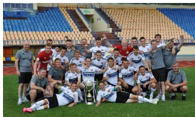
«Торпедо-БелАЗ» - обладатель Кубка Беларуси (2016)