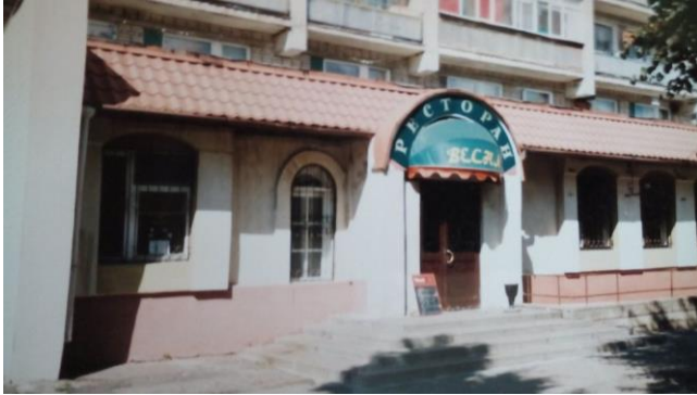
Кафе «Весна» (2001)